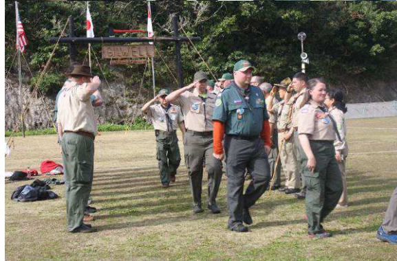
全日程を終えスタッフに送られ退場