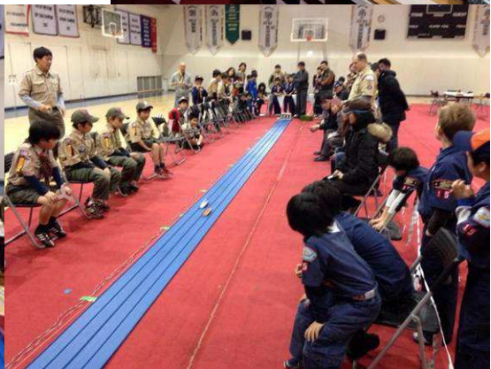
エントリー車両 (右中) レースの様子 (下左右)