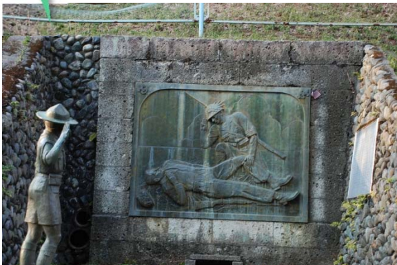
無名戦士(アンノウソルジャー)の像