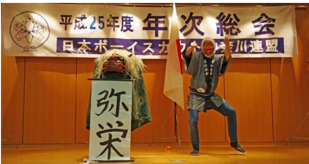
ボーイスカウトのお正月！？

第二部終了後に横須賀地区の指導者参加による獅子舞のアトラクションもあり、和やかな総会の締めと平成25年度スタートの景気つけになりました。