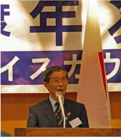
佐野副連盟長 挨拶

今年度は横須賀地区の担当にてご準備を頂き、平成25年5月12日(13:00～17:00)にヴェルクよこすかにて滞りなく開催されました。