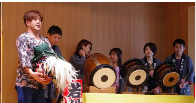
地元の皆さんとの熱い交流