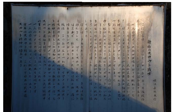
アンノウソルジャーの実話