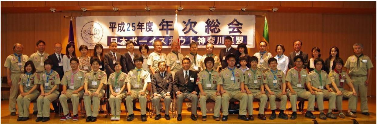
平成24年度の富士章スカウトとそれを支えた保護者・指導者

第二部終了後に横須賀地区の指導者参加による獅子舞のアトラクションもあり、和やかな総会の締めと平成25年度スタートの景気つけになりました。